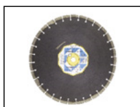
kotouč řezací asfalt