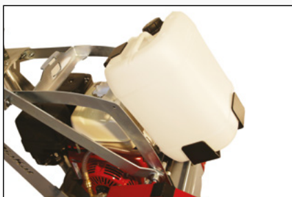
nádrž na vodu