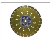
kotouč řezací beton